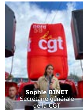
Sophie BINET Secrétaire générale de la CGT