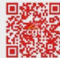
Vidéo de Sophie BINET appelant au vote