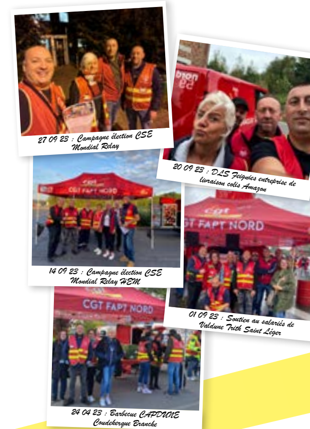
27 09 23 : Campagne élection CSE Mondial Relay