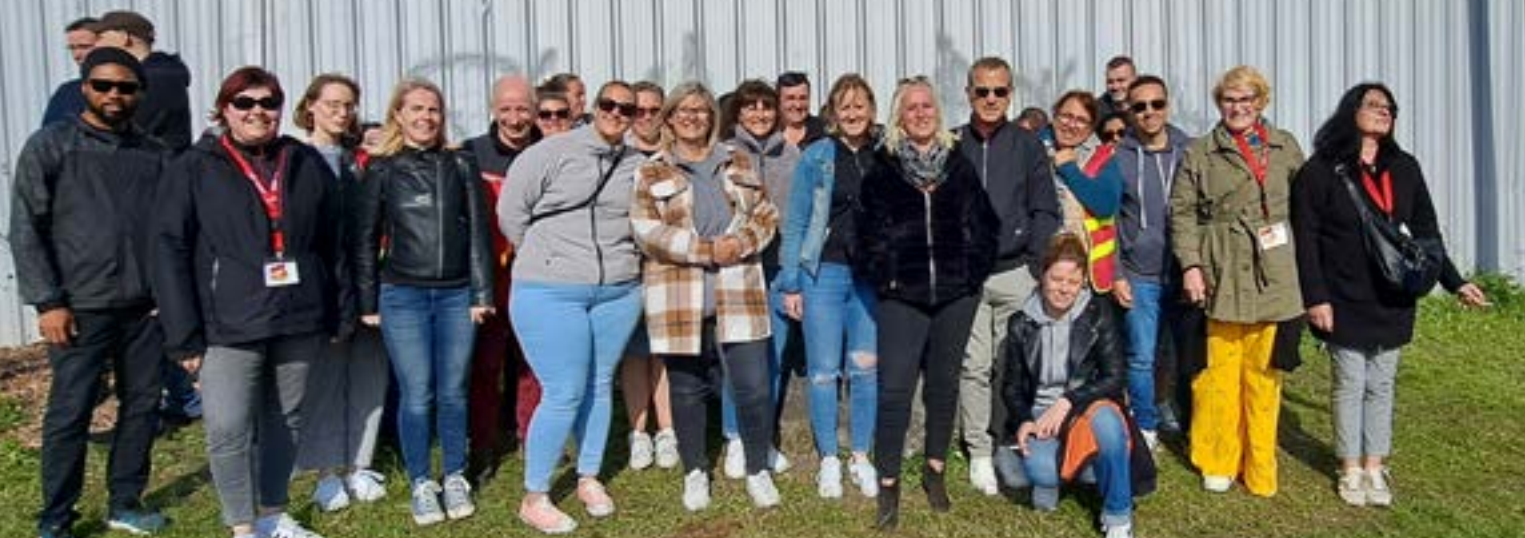
LA FAPT AVEC LES CAMARADES DE VERTBAUDET

La CGT Fapt 59 vous sera toujours reconnaissant et respectueux de votre combat historique de femmes que vous menez depuis lundi 20 mars 2023.