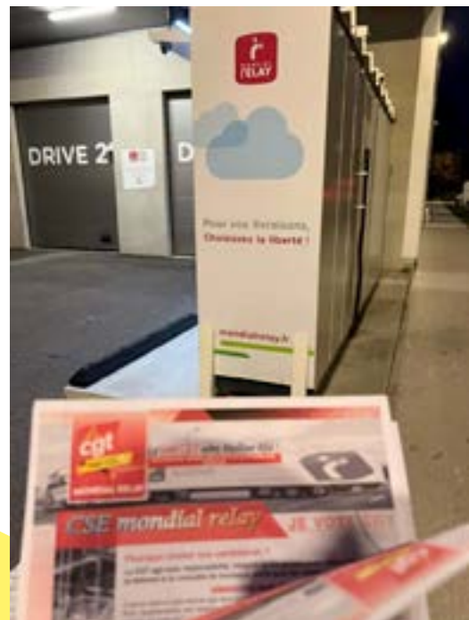
Tractage pour les élections CSE Mondial Relay