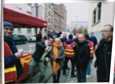
Regroupement le 05/12/22 Centre financier pour défendre une camarade