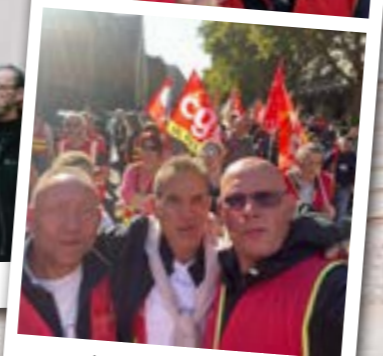
Manifestation Lille 18/10/22