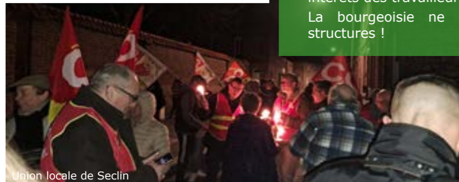
Union locale de Seclin

La bourgeoisie ne décidera pas pour nos structures !