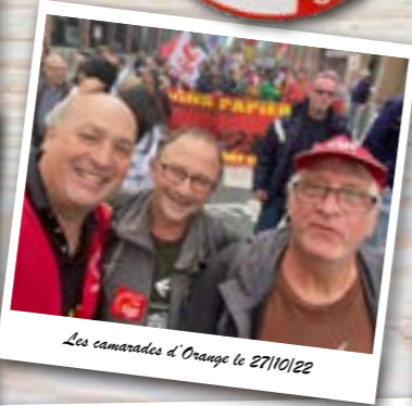
Les camarades d'Orange le 27/10/22