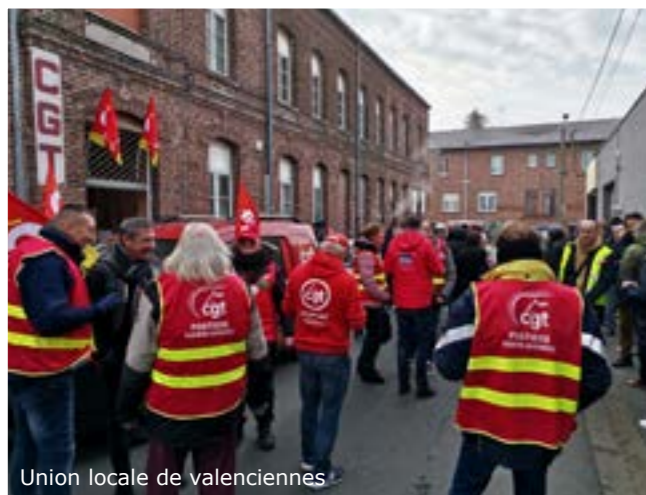
Union locale de valenciennes

Il était de mise que les mairies allouaient les locaux gracieusement aux organisations syndicales et plus particulièrement à la CGT. Parce qu'elles représentaient des organisations d'utilité publique.