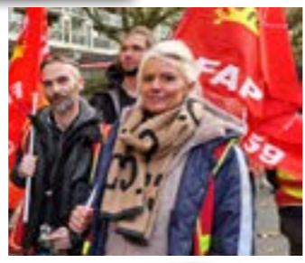
10/11/2022 Manifestation 14h30 porte de Paris Lille